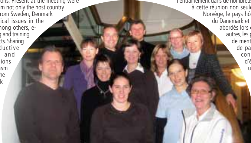
DEN, NOR, SWE, FIN together!

Representatives of Nordic gymnastics federations gathered at their annual meeting to discuss and learn about different themes of training in various federations. Present at the meeting were representatives from not only the host country Norway, but also from Sweden, Denmark and Finland. Topical issues in the meeting were, among others, e-learning, mentoring and training development projects. Sharing thoughts, productive conversations and exchanging opinions brought enthusiasm and new ideas to the development work in training.