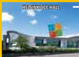
HELSINKI ICE HALL

Exhibition and Convention Centre, Olympic Stadium, Ice Hall, Töölö Sports Hall, Hartwall Arena, Finnair Stadium etc. Read more: www.helsinki2015.com