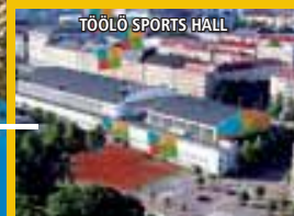
TÖÖLÖ SPORTS HALL

Les valeurs de la Gymnaestrada constituent la base du travail de la gymnastique pour tous à l'échelle mondiale : la participation de tous est importante, ainsi que le travail d'équipe, le fair play, la solidarité, et la création d'une union entre les personnes, les générations et les nations. En association avec le Comité GFA de la FIG, nous souhaiterions développer à Helsinki certaines idées dans l'esprit de la Gymnaestrada :