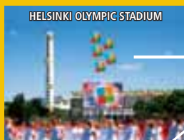
HELSINKI OLYMPIC STADIUM