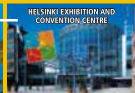
HELSINKI EXHIBITION AND CONVENTION CENTRE