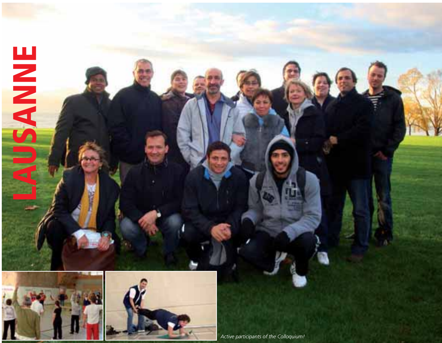
Active participants of the Colloquium!